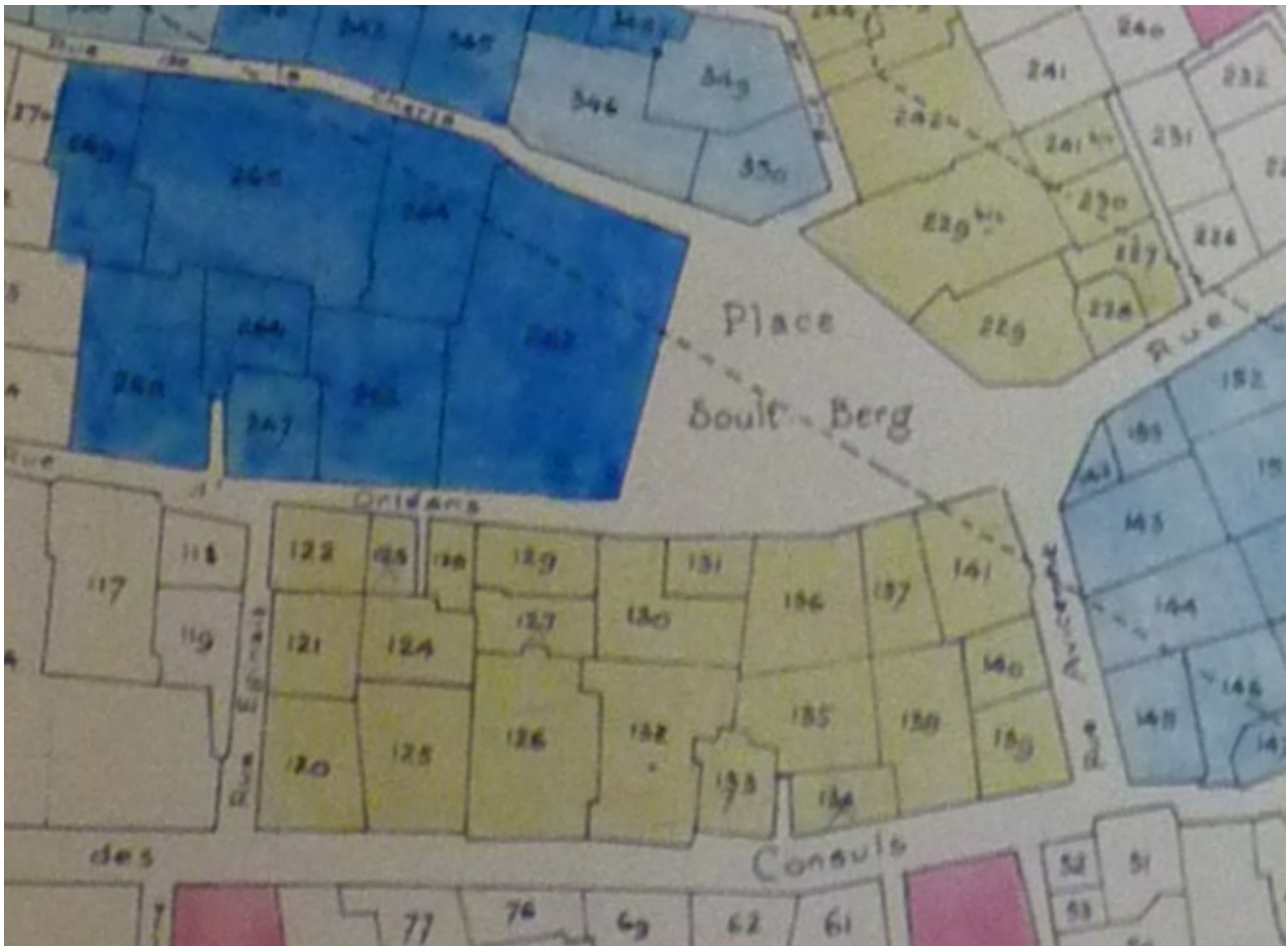
Carte 2. Détail de la carte 1 centré autour de la place Soutt-Berg