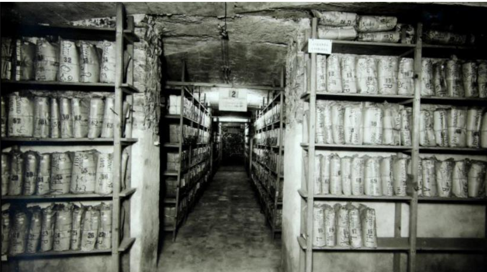
Archives de la préfecture d'Alger en 1934 (Archives nationales -France-, AB-XXXI-C 293)

https://evento.renater.fr/survey/colloque-archives-fantomes-fantomes-d-archives-7s4nfwel